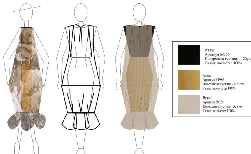
Рис. 3. Конструкторсько-технологічне вирішення однієї з моделей колекції суконь

Так в результаті перетворення творчого джерела (форм світильників у стилі лофт та інших характерних елементів інтер'єру) було розроблено проєкт моделей авторської колекції суконь.