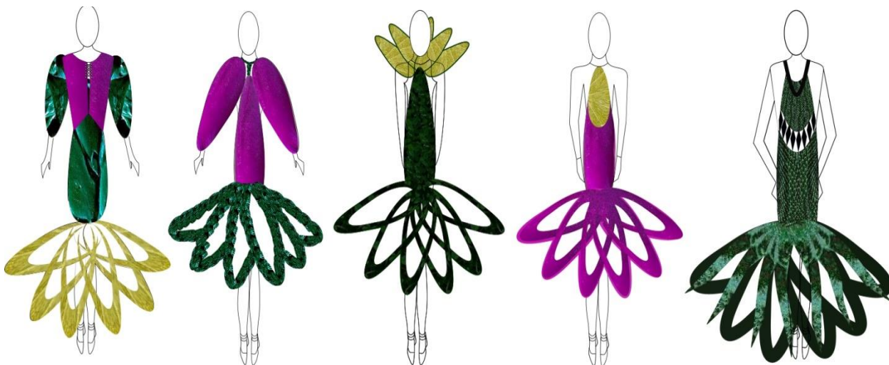
Рис. 3. Кольорово-фактурне вирішення моделей колекції суконь.

Перехід від ескізного зображення нових моделей до їх виготовлення в матеріалі відбувається поетапно: спочатку відбувається вибір методів отримання об'ємно – просторової форми, що відображається на технічному рисунку, та паралельно до цього підбираються текстильні матеріали, які за своїми характеристиками (кольором, фактурою, поверхневою густиною та іншими) здатні відтворити задум авторів колекції, після чого будується конструкція моделей та обираються методи обробки.