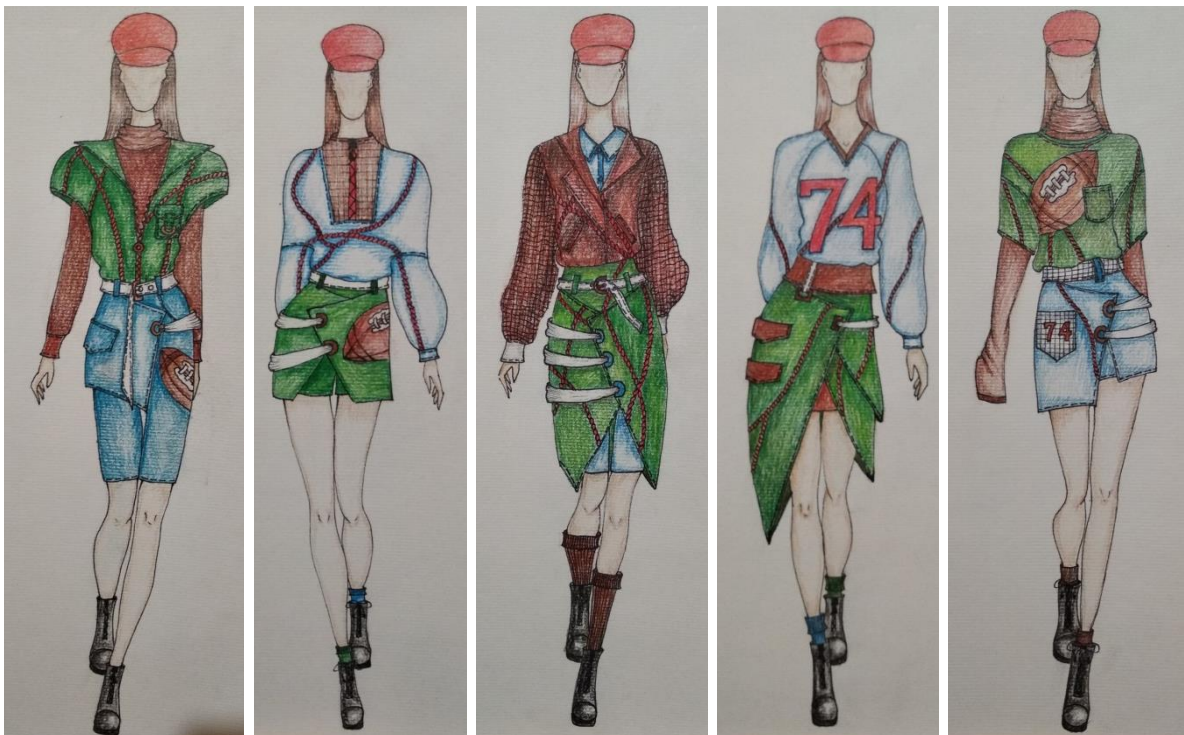
Рис. 3. Колекція жіночого одягу "Strong woman" (автор Ольга Черномазюк)

Moodboard авторської колекції одягу під девізом "Strong woman" (рис. 2) виконано у вигляді фотографій та малюнків, які представляють основні тематично-сюжетні напрямки кінофільму "Невидима сторона": це атрибути спортивної форми гравців в американський футбол, а також символічні малюнки рук, що уособлюють доброту, допомогу та підтримку. Крім того, Moodboard визначає напрямок оздоблення виробів майбутньої колекції та її колористичне вирішення.