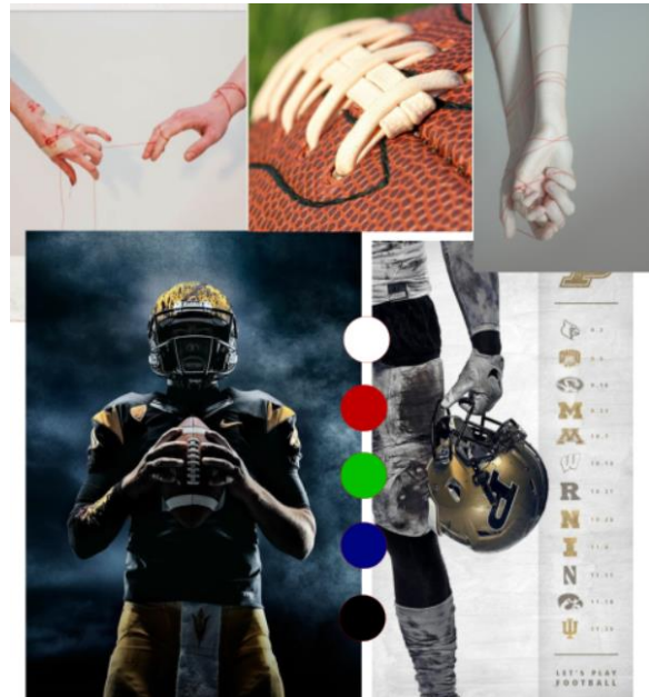
Рис. 2. Moodboard колекції "Strong woman" (автор Ольга Черномазюк)

Moodboard авторської колекції одягу під девізом "Strong woman" (рис. 2) виконано у вигляді фотографій та малюнків, які представляють основні тематично-сюжетні напрямки кінофільму "Невидима сторона": це атрибути спортивної форми гравців в американський футбол, а також символічні малюнки рук, що уособлюють доброту, допомогу та підтримку. Крім того, Moodboard визначає напрямок оздоблення виробів майбутньої колекції та її колористичне вирішення.